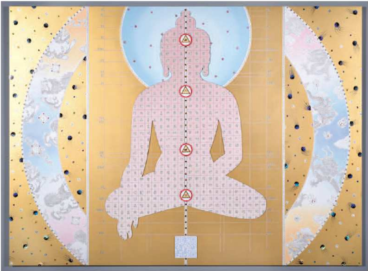
Gonkar Gyatso, 2014, Pendulum of Autonomy , mixed media collage and Dibond on aluminum honeycomb panel, 152.4x203.2 cm, 60x80 in.